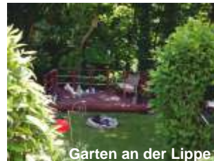
Garten an der Lippe